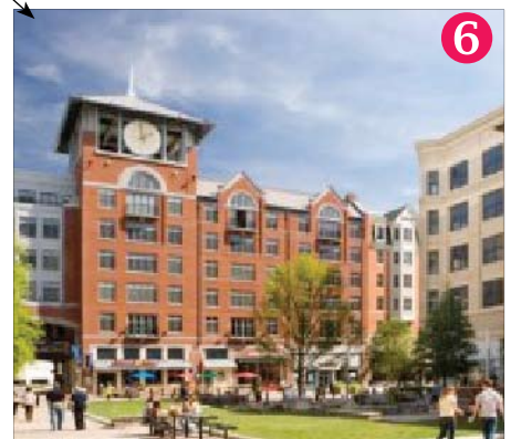
Några andra kvarter.