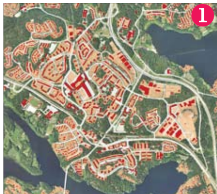
Så här ser det ut idag

Slutresultatet skulle kunna se ut som på bilderna 3-6. Dubbelt så många får plats!