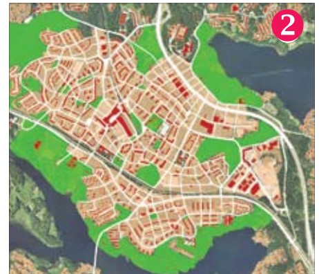
Nya kvarter, nya gator, nya parker – på bekostnad av ingenting-mark.