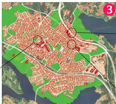
Dubbelt så många hus. De befintliga står kvar. Det nytillkomna är bara exempel, möjligheter, exakt hur det blir bestäms lokalt.